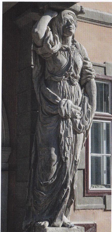
Cele două cariatide gigantice care susțin balconul Casei cu cariatide (1786) / The two giant caryatids that support the balcony from the Caryatid House (1786)